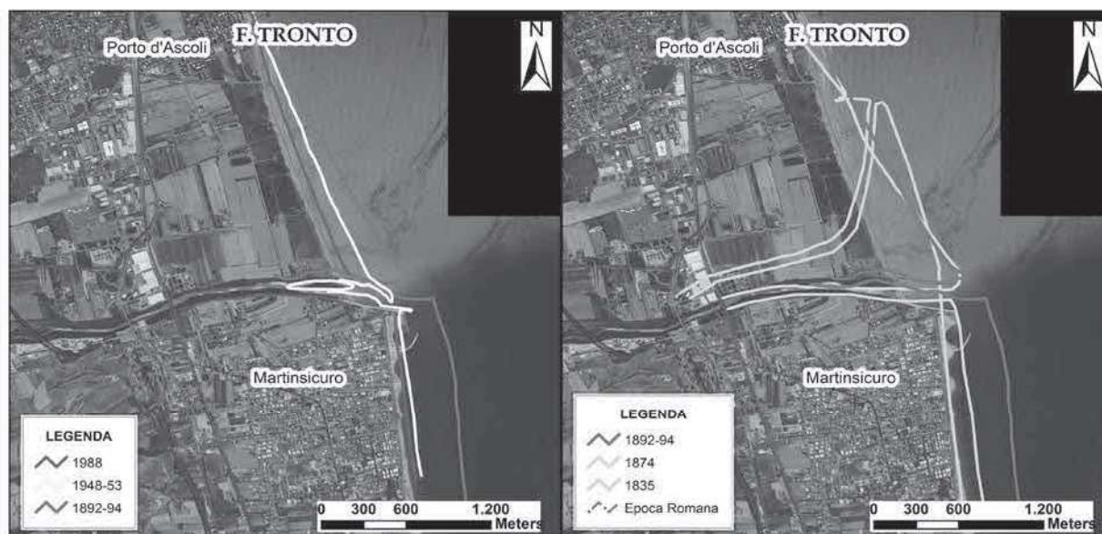
Figura 4. Evoluzione della foce del Fiume Tronto durante il XIX secolo (a sinistra) e il XX secolo (a destra)