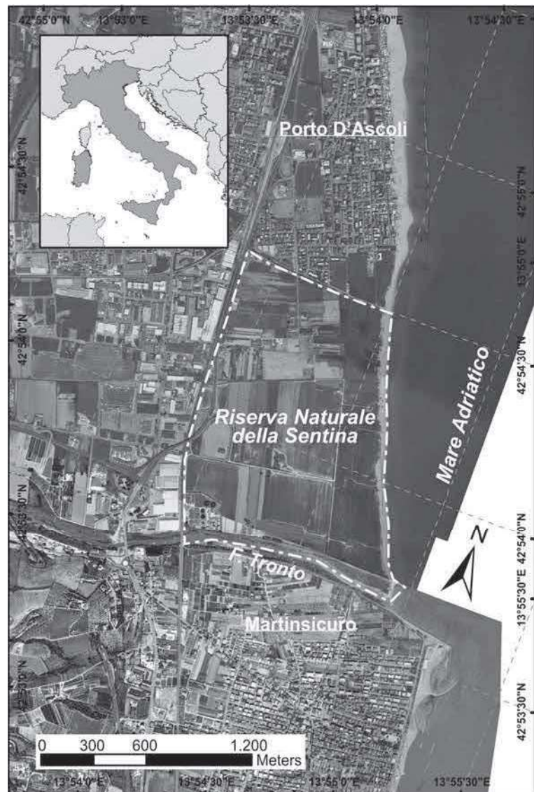
Figura 1. Vista aerea della Riserva Naturale Regionale della Sentina.

Nel 2009 e nel 2012 sono inoltre stati effettuati due rilevamenti topografici di dettaglio con stazioni totali e nel 2015 un rilievo tramite drone alare eBee. Le variazioni progressivamente rilevate, immesse in ambiente GIS, sono state analizzate utilizzando il software SDAS (Thieler et al. , 2009). Da questi studi è emerso che la spiaggia della Sentina è costantemente arretrata per tutto il periodo di indagine. In particolare, tra il 2000 ed il 2006 è stato calcolato un arretramento medio di 27.7 m, con picchi di 33.5 m registrati nella porzione centrale della spiaggia (Fig. 2, transetti 38-42), mentre nelle porzioni estreme, a nord e a sud, il tasso di arretramento si è mantenuto al di sotto dei 10 m. Nello specifico, i primi 150 m di spiaggia a nord risentono